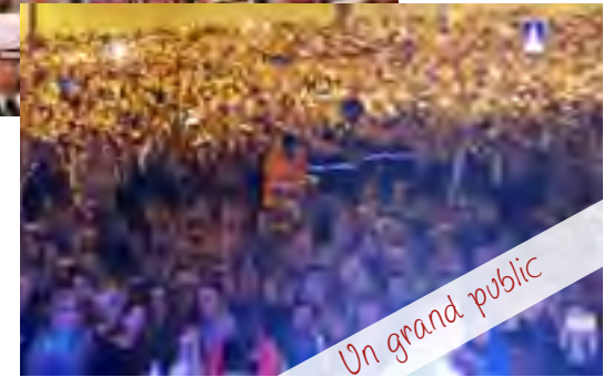
Un grand public