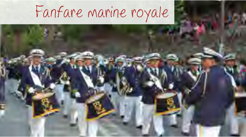
Fanfare marine royale